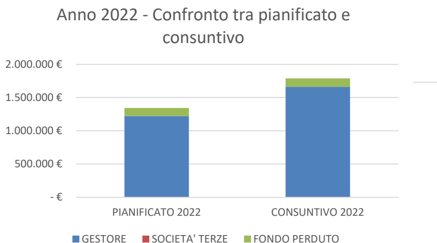
Fig.1 – Istogramma di confronto tra quanto pianificato e quanto rendicontato nel 2022

Dalla tabella sopra riportata si nota come il gestore HERA abbia effettuato nel corso del 2022 investimenti superiore rispetto al pianificato per circa il 33%.